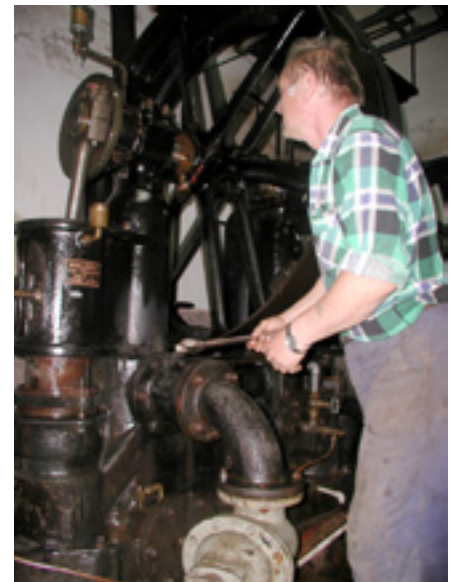
Unikalne stojące pompy typu Weise-Monski z 1909 r. pracującą dotąd w „Bielawie”.

Jeśli Sowiogórski Festiwal Techniki krzepnie, zawdzięcza to zaangażowaniu samorządów i władz miejskich Dzierżoniowa, Świdnicy, Bielawy, Żarowa, Walimia i Nowej Rudy, a także mecenatowi Politechniki Wrocławskiej, licznych instytucji gospodarczych, wśród których są tacy potentaci jak 3M Poland, Centrostal Wrocław S.A., EnergiaPro, Koncern Energetyczny O/Wałbrzych, Odratrans