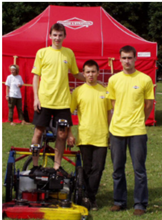
Zwycięska drużyna z kosiarką.

której trzeba było przedstawić metodologię projektowania oraz informacje o trawie i jej koszeniu. Okazało się, że potrzebna jest tu niemała wiedza, którą nasi konstruktorzy zdobyli dzięki konsultacjom u jednego z naukowców z wrocławskiej Akademii Rolniczej. Później był pokaz praktyczny – trzeba było skosić trawę na wskazanym terenie.