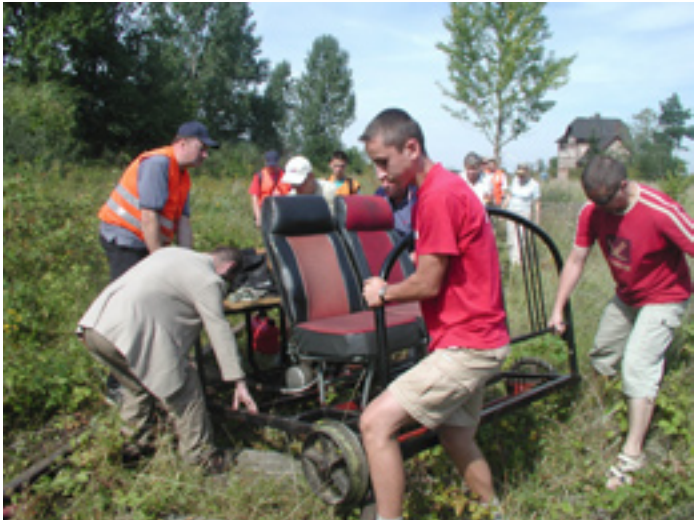
Pasjonaci przenoszą drezynę w miejscu, w którym zabrakło torów (dezindustrializacja po polsku).