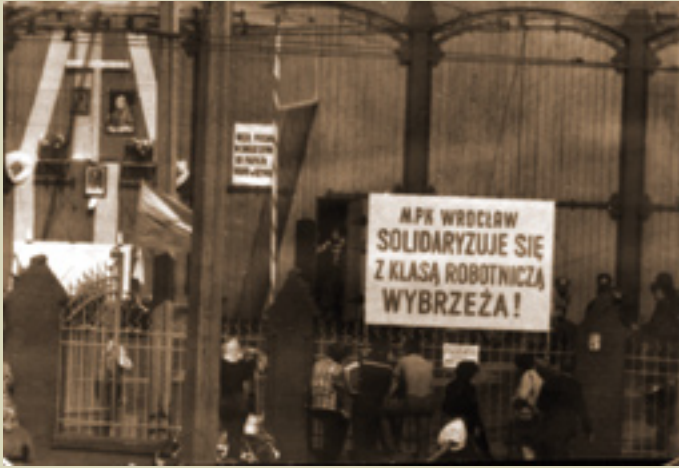
Sierpień 1980 w zajezdni MPK