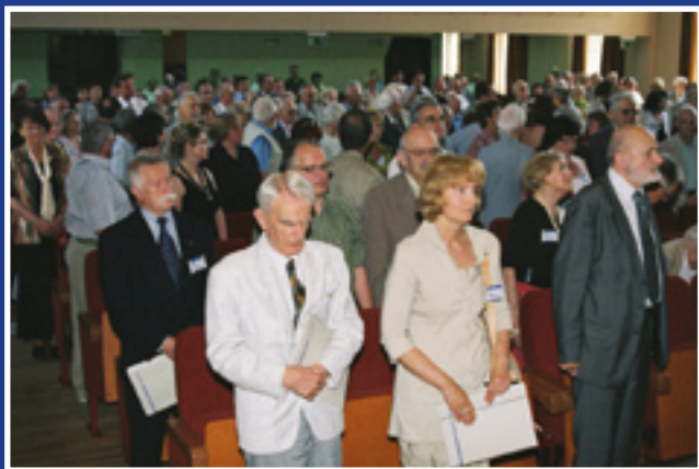
Wspomnienie z chwilą ciszy

Wydziału Architektury Politechniki Wrocławskiej