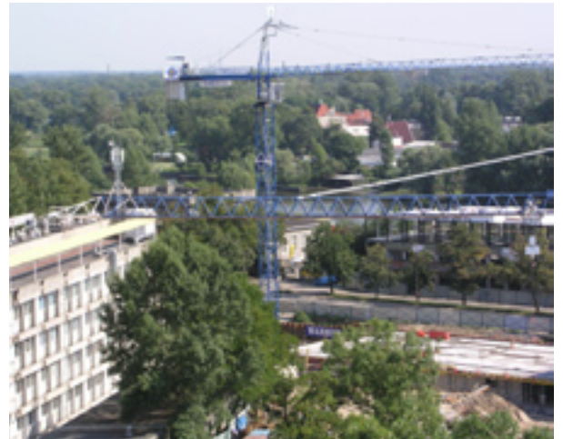
A jednak powstanie tutaj Zintegrowane Centrum Studenckie.

Tym razem jednak zagrożenie było znacznie poważniejsze. Radziecka bomba lotnicza ważyła bowiem aż pół tony, zatem jej siła rażenia była dużo większa. Saperzy uznali ją za skrajnie niebezpieczną. Dlatego zanim przystąpili do jej przetransportowania na poligon, gdzie ostatecznie została zdetonowana, nakazali policji przeprowadzenie ewa-