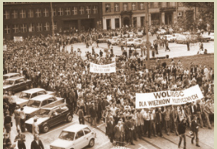
Wrocławski Rynek – manifestacja w maju 1981 r.

Godziny otwarcia: wtorek – piątek: 10:00 – 17:00 sobota – niedziela: 10:00 – 16:00