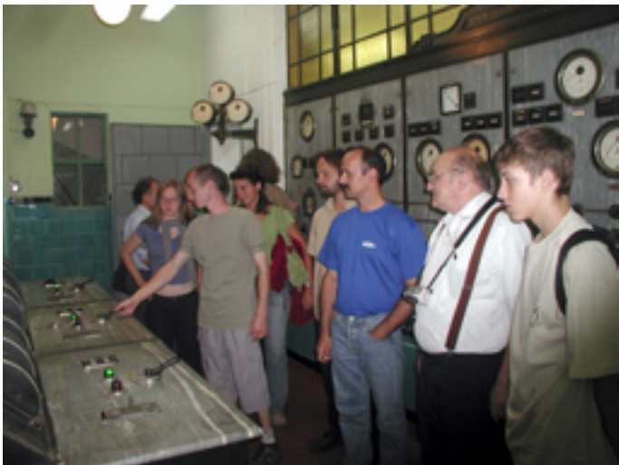
Oparta o urządzenia z 1913 r. nadal czynna elektrownia wodna w Lubachowie