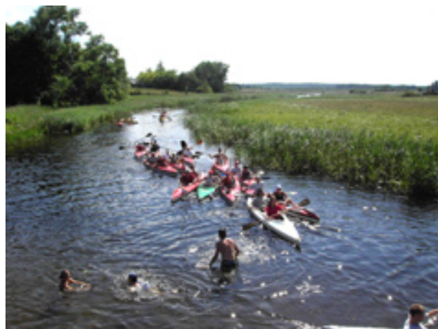
Spływ kajakowy po Krutyńi.

Seminaria przygotowane przez nas jeszcze w trakcie semestru dotyczyły przede wszystkim sezonowości obciążeń środowiska i ich skutków. Chodzi tu na przykład o