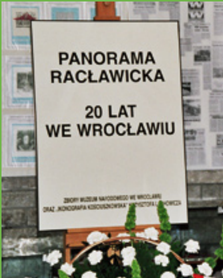
Panoramę Raclawicką można oglądać we Wrocławiu już od 20 lat.