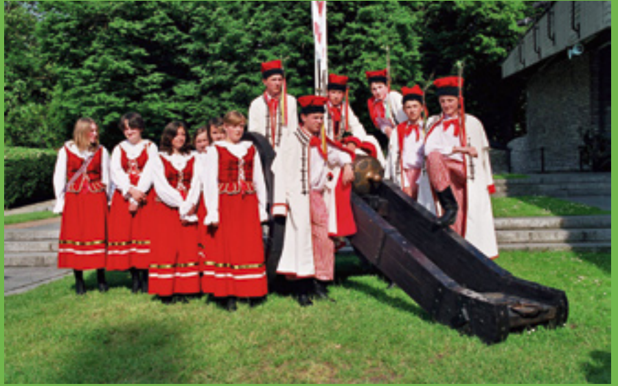
Społeczny Komitet Panoramy Raclawickiej od grudnia 1980 r. utrzymywał kontakt z mieszkańcami Raclawic. Na jubileusz przybyła ich liczna delegacja.