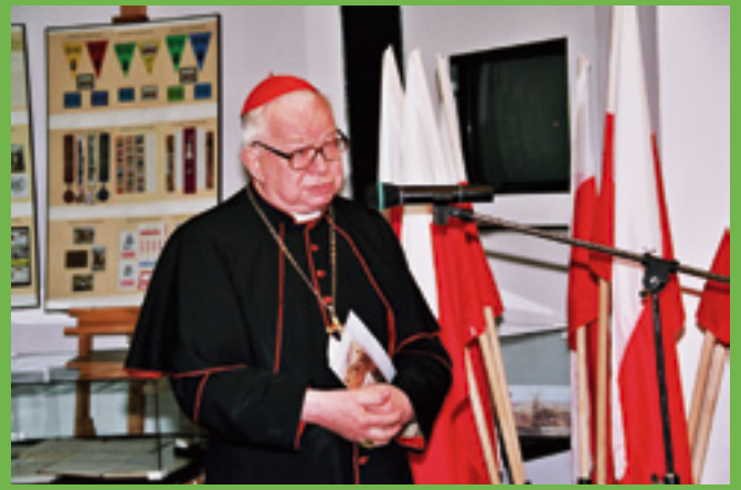
Członek Społecznego Komitetu Panoramy Raclawickiej kardynał Henryk Gulbinowicz zawsze wspierał idee i działania na rzecz Panoramy.