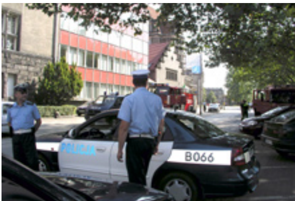
Policja zamknęła wjazd w ul. Norwida.

kuacji pracowników Politechniki i mieszkańców ul. Norwida i Wybrzeża Wyspiańskiego. Blisko tysiąc ludzi musiało opuścić na 3 godziny domy i biura.