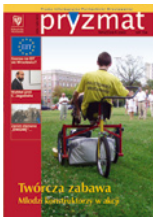
Politechniczna drużyna zwyciężyła w zawodach Briggs & Stratton.