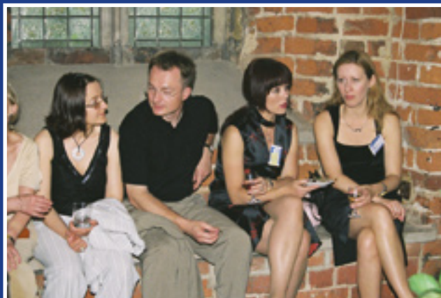
Najmłodszy uczestnicy zjazdu w Muzeum Architektury.