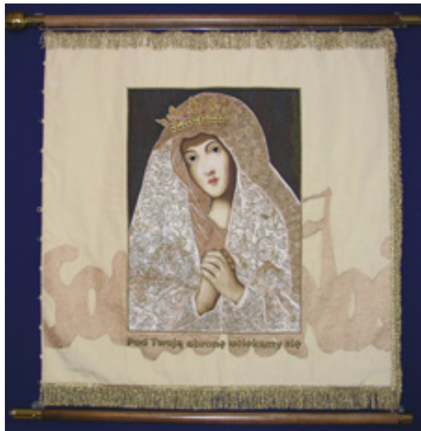
Sztandar KZ NSZZ „Solidarność” PWr

Dzisiaj raduje się z nami cała Polska mówiąc: „Honor Wam, solidarni”, czy może „nam”, bo byliśmy solidarni w strajkach, które się wtedy działy w całej Polsce