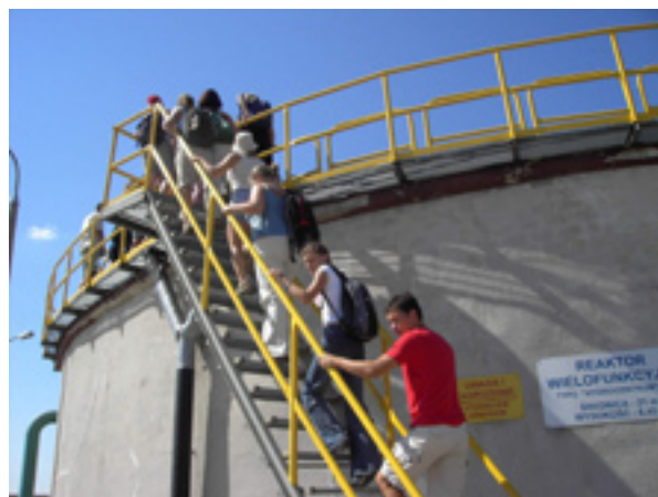
Studenci zwiedzają reaktor wielofunkcyjny typu „Hydrocentrum”

Pouczające były wycieczki do oczyszczalni ścieków i stacji uzdatniania wody. Wyruszyliśmy po śniadaniu, wszyscy zaopatrzeni w kremy z filtrami (słońce grzało jak oszalałe przez całe 14 dni!) oraz koniecznie w wodę (bo któremu studentowi nie chce się