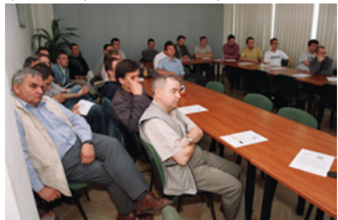
Wykład wzbudził żywe zainteresowanie słuchaczy.