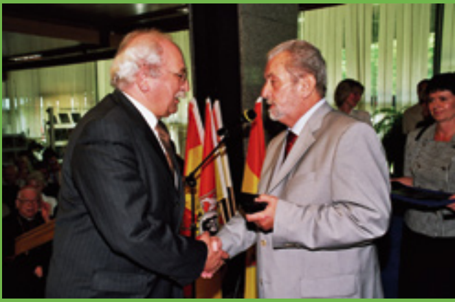
JM Rektor odbiera medal wyrażający uznanie dla zasług pracowników Politechniki Wrocławskiej w pracy na rzecz przywróceniu narodowi Panoramy Raclawickiej.