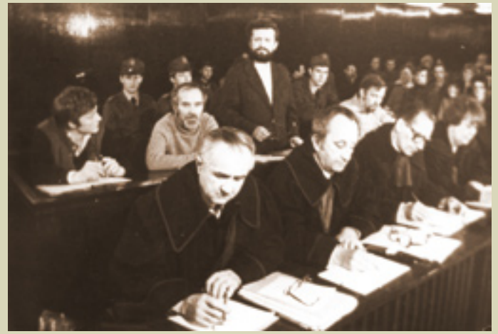
Proces Komitetu Strajkowego Politechniki Wrocławskiej – 1982 r.