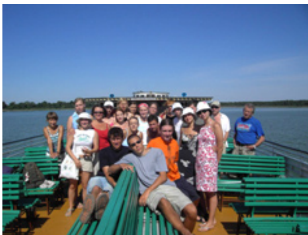
Podczas wyprawy po próbki mikroflory i mikrofauny na Śniardwach.

kład o skutki ruchu turystycznego. Rozważaliśmy, jakie technologie oczyszczania ścieków są najbardziej przydatne w regionach turystycznych i jak powinna wyglądać tam gospodarka odpadami. Nie zabrakło również zajęć charakteryzujących Pojezierze Mazurskie pod względem społecznym, gospodarczym i przyrodniczym. Teraz zdobytą wiedzę mogliśmy skonfrontować z rzeczywistością. Pierwszego i ostatniego