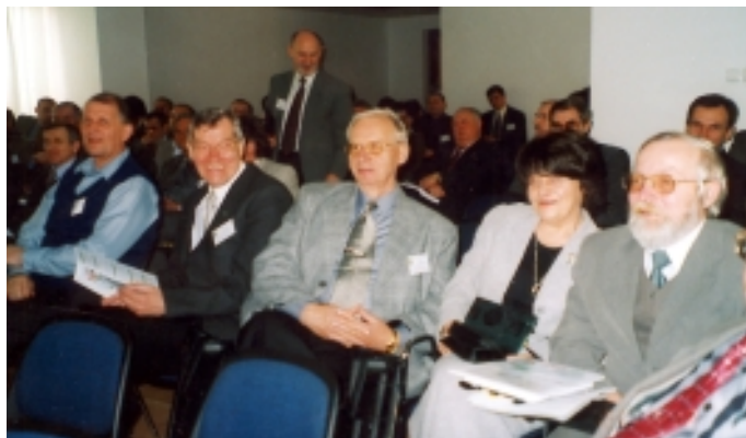
Na sali obrad