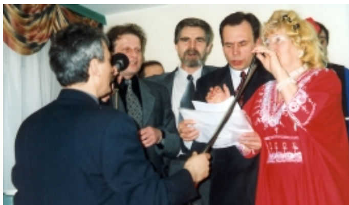
Występ gości z Permu (RAN)