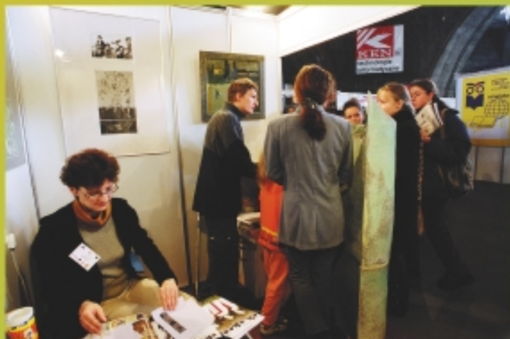
Nagrody otrzymały również stoiska Wydziału Chemicznego UWr i Akademii Sztuk Pięknych.