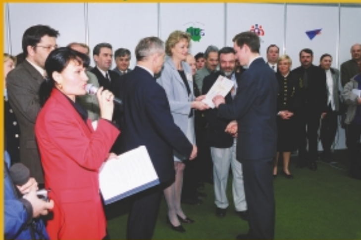
Wśród nagrodzonych było stoisko Samorządu Studenckiego PWr