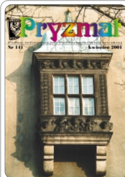
Kto wygląda przez te okna?