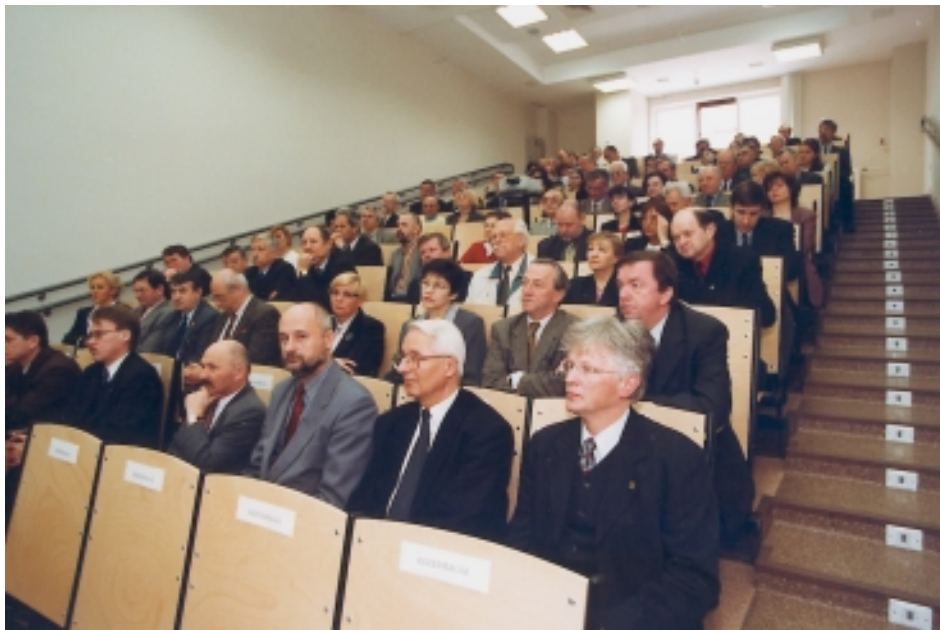
W czasie I Sympozjum

celowych zamawianych przewiduje się wykorzystanie aktywności tego rodzaju centrów do realizacji ważnych ze względów społecznych i gospodarczych zadań z zakresu rozwoju nauki i techniki.